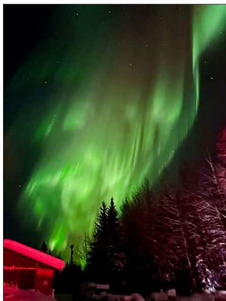
● Serenella Tardivo, Aurora boreale, Alaska, 2024

Per farsi capire indicò un abete come dimostrazione della vita eterna, avendo sempre le foglie verdi; come simbolo di protezione, perché con il suo tronco venivano costruite le loro case; con la sua cima